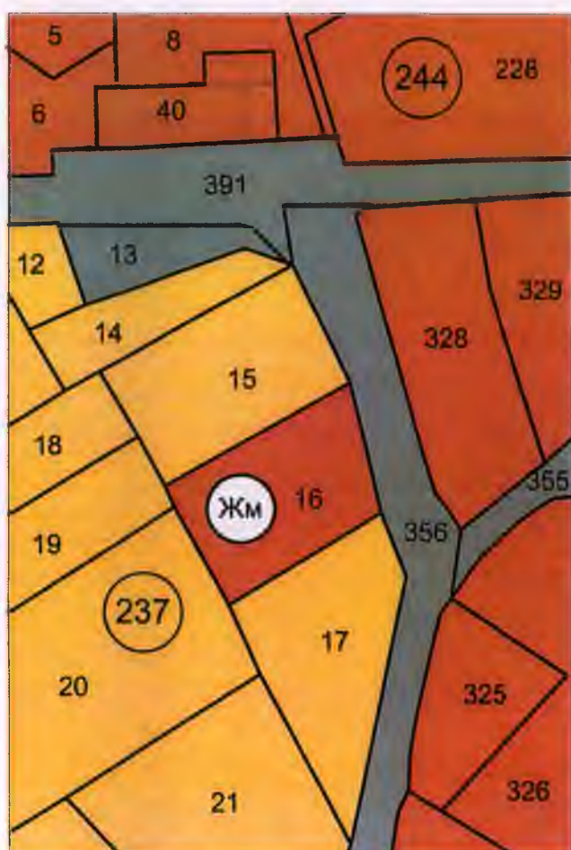
Предложение за изменение на ОУПО Севлиево за ПИ 40275.237.16 по КККР на с. Кръвеник М 1:1000